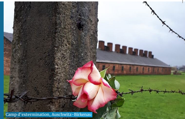
Camp d'extermination, Auschwitz-Birkenau